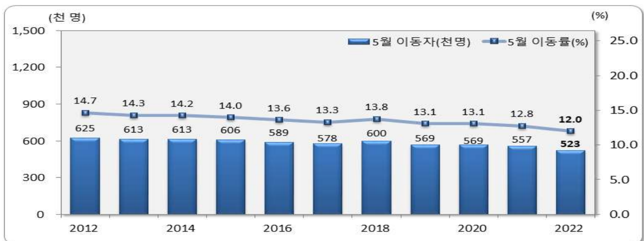
[그림 1] 전국 5월 인구이동