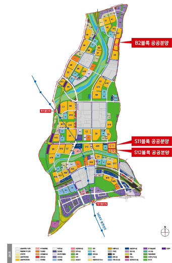
< 토지이용계획도 >