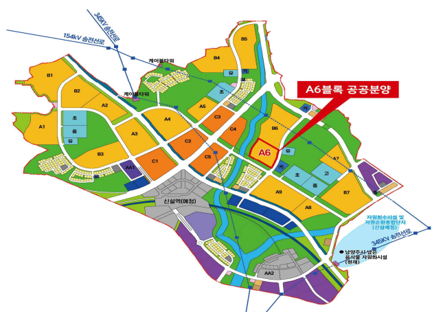
< 토지이용계획도 >