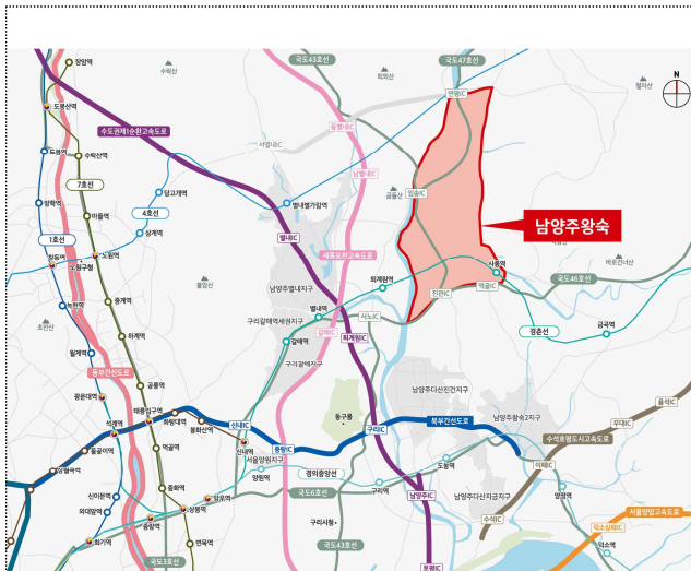
< 남양주왕숙지구 위치도 >

○ 남양주왕숙2 A6 블록은 초·중·고등학교, 하천으로 둘러싸여 입지가 좋고, 추정분양가는 4.1억원(전용 59 m^2 )에서 5.7억원(전용 84 m^2 ) 수준이다.