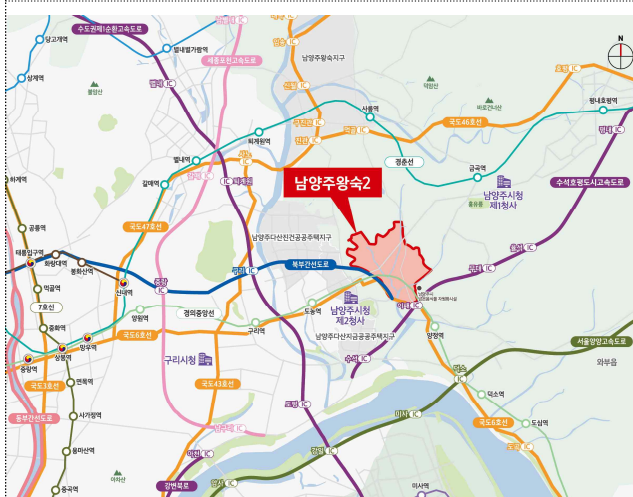
< 남양주왕숙2 위치도 >