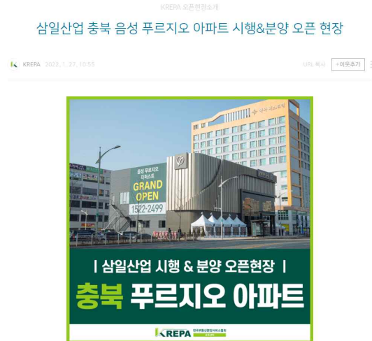
회원사 '삼일산업' 오픈현장 소개글